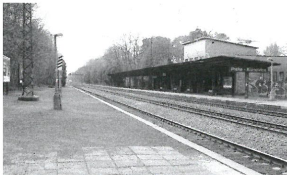
Při budování koridoru přibudou nejen stěny, ale doufejme, že se vyřeší i stav nádraží