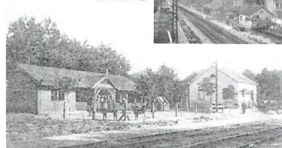
Nádraží Klánovec v roce 1897 jako zastávka žrn